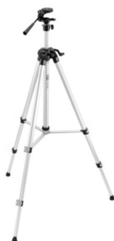
SJJ-M1 EX stativ